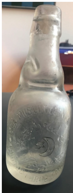
Flaša iz druge polovine 19.st. među prvim je eksponatima antropološke zbirke. Na flaši piše: “Prva muslimanska tvornica sode”. Arh.iskop. Hadži Kalinova džamija, Sarajevo.