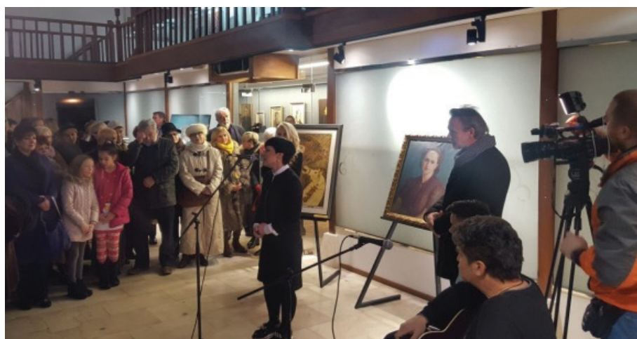
Fotografija s otvaranja prve antropološke izložbe Muzeja Sarajeva: “Sarajke na platnima bh. slikara”, Brusa-bezistan, 17.1.2019.