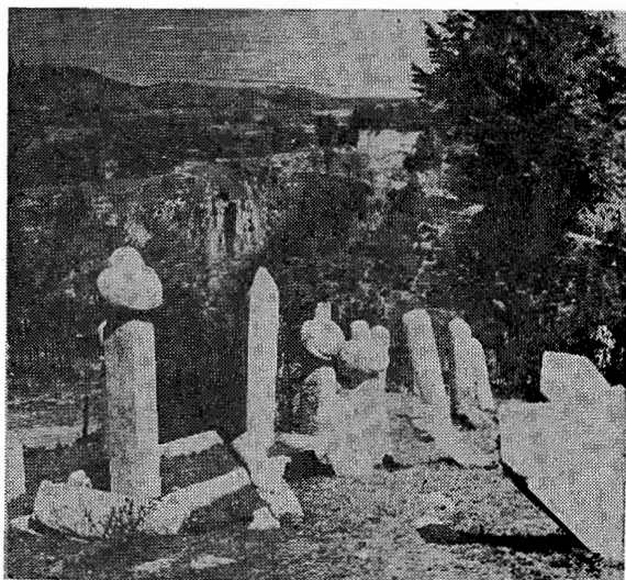
Dio groblja na Alifakovcu

Konkretno, dakle: u novoj regulaciji grada morala bi Općina osigurati sebi prvenstveno pravo na zemljište, gdje se danas prostiru muslimanska groblja, da ih sačuva i upotrijebi za pluća budućeg Sarajeva, tj. za javne parkove!