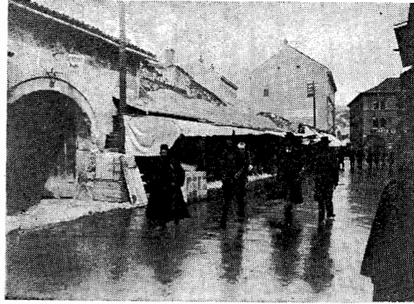
Ostaci Tašlihana prije rušenja rušenja