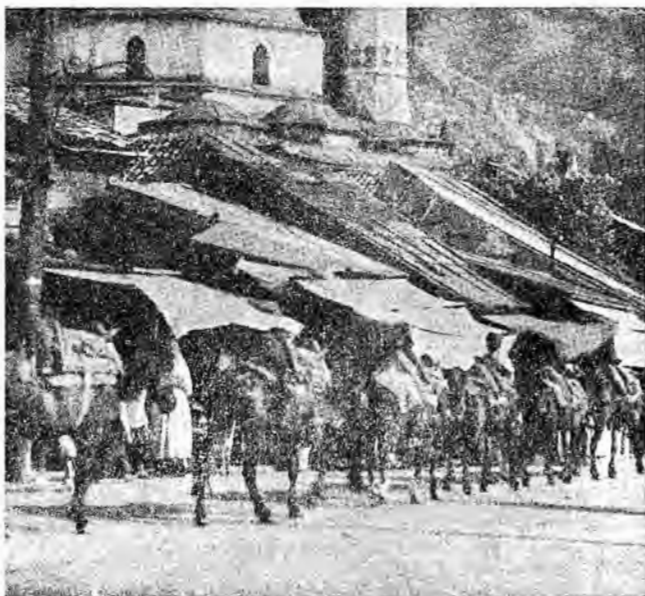
Dučani ispred Bašaršijske džamije — smisao za ljepotu i osjećaj za mjerilo.

Svaki novi stil — kaže Wagner — nastao je postepeno iz prijašnjeg, tako da su nove konstrukcije, novi materijal i nove zadaće zahtijevali mijenjanje postojećih formi ili stvaranje novih.