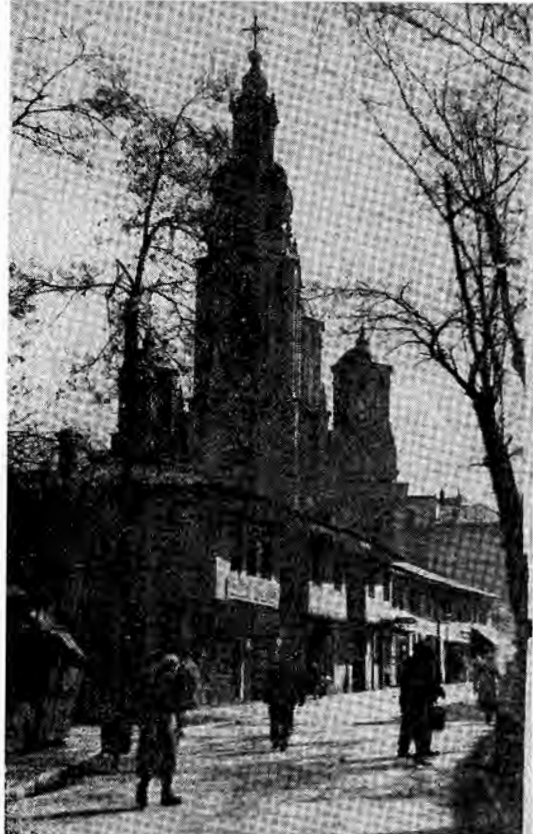
Lijevo: Saborna crkva okružena starijim kućama, koje su porušene da bi se formirao trg