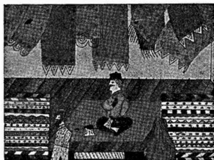
Trgovanje u čaršiji (dječji crteži iz škole Z. Dideka)