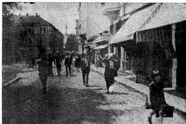
Ulica Vase Miskina nekad — u dnu džamija na mjestu današnjeg nebodera.

Uprava Mirovnog fonda u Zagrebu htjela je Ljubljancima ograničiti sredstva gradnje time što im je propisala izgrađenu površinu, a Ljubljanci su je mimošli time što su određenu površinu zadržali, a gradili uvis.