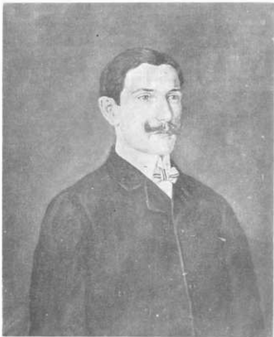
Jovan Bijelić: Portret Pavla Tiješića , ulje na platnu, 1907. g.

tivan društveni radnik, između ostalog glavna motorna sila elitne umjetničke formacije «Oblik», njen stalni sekretar, onaj spiritus rector za čije su ime vezane gotovo sve akcije ove inače veoma dinamične umjetničke grupe. U toj funkciji Bijelić, prvom polovinom februara mjeseca 1931. g., ide u Sarajevo i Banjaluku radi pripremanja terena za organizaciju «Oblikovih» izložbi u ovim mjestima. 13. aprila ponovo je došao u Sarajevo, gdje otvara V. izložbu umjetničke grupe «Oblik».