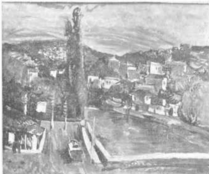
Jovan Bijelić: Sarajevo , ulje na platnu, 1932. g.

Septembra 1912. Bijelić je u društvu s Đ. Mazalićem i Petrom Tiješićem (studentima akademija likovnih umjetnosti u Budimpešti i Krakovu), u Društvenom domu u Sarajevu, prvi put pred oči domaće javnosti izložio svoja platna. I mada je izložba imala katalog radova, 56 danas je teško saznati koliko je i koje je sve radove umjetnik izložio u ovoj prilici. Jednostavno katalog te izložbe danas više nije moguće pronaći.