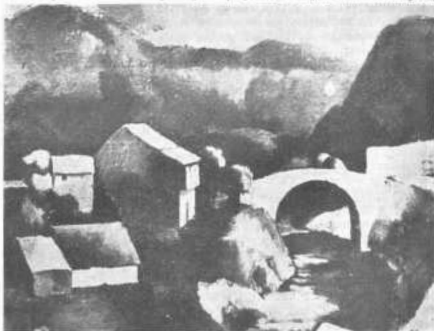
Jovan Bijelić: Kozja čuprija kod Sarajeva , ulje na platnu, 1924. g.

Nakon studija Bijelić dobiva dekret Zemaljske vlade (akt. br. 93.857 V-3 od 23. IX 1915) o postavljenju za asistenta crtanja na Velikoj gimnaziji u Bihaću, s mjesečnom plaćom od 1600 kruna. 48 Povučeni u osamu, u mir i sreću tek osnovane porodice, Bijelić već od prvih dana počinje da slika. Djelujući tako, on je za dosta kratko vrijeme uspio da sačini veći broj radova da bi između njih mogao da izvrši izbor deset najkvalitetnijih koje će eskponirati na »Izložbi umjetnika iz Bosne i Hercegovine«, priređenoj oktobra 1917. g. u Sarajevu. Zato nije nerazumljiv i uspjeh koji je doživio kod publike i kritike u ovom mjestu. 49 Ohrabren povoljnim prijemom svojih slika u Sarajevu,