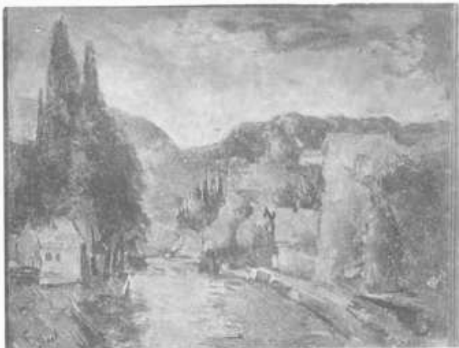
Jovan Bijelić: Kod Sarajeva , ulje na platnu, 1929. g.

Tako on, u pokušaju da osvježi inspiraciju, u ljeto 1924. g. polazi s porodicom u Bosnu. Put ga vodi preko Sarajeva, gdje odsijeda kod prijatelja svoje žene, obitelji Delijanisa, u Strossmayerovoj ulici broj 3. Došao je s dugom kosom, poput nekog poete, i štapom — »ciupaga« — u ruci. Tokom šestnedjeljnog boravka, zajedno s Vladimirom Be-