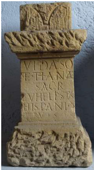
Slika 6. ( Ubi erat lupa : http://lupa.at/10841/photos/1 )

II. AIJ 517 = EDCS-ID: EDCS-11301116 = HD 052277 = TM 197277 10 : VIDASO / ET•THANAE•/ SACR / EVHELPISTVS / 5 HISPANI S / I? V S. Vidaso / et•Thanae / sacr(um) / Euhelpistus / 5 Hispani•s(ervus) / i? •v(otum)•s(olvit) . „Vidasu i Thani svetom, Euhelpis, Hispana rob, zavjet učini.“ Spomenik je pronađen u zimu 1936/37. godine na položaju Blatne kupce u Topuskom.