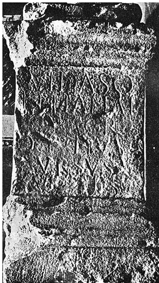
Slika 7. ( Ubi erat lupa : http://lupa.at/11598/photos/1 )

IV. CIL 03, 10819 = CIL 03, 14354,23 = D 3910 = ILS 3910 = AIJ 518 = AE 1901, 216 = EDCS-ID: EDCS-29000490 = HD 032883 = TM 196177 12 : VIDASO / ET THANAE / SACR / Q IVLIVS / 5 VRSVS / V S. Vidaso / et Thanae / sacr(um) / Q(uintus) Iulius / s Ursus / v(otum) s(olvit) . „Vidasu i Thani, svetom, Kvint Julije Ursus, zavjet učini.“ Spomenik je pronađen 1886. godine u župnom vrtu u Topuskom.