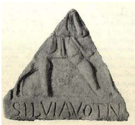
Slika 2. (Patsch 1894, 344, slika 3.)

Sljedeći koji se pozabavio ovim zanimljivim nalazom bio je Carl Patsch koji je predstavio i reviziju tumačenja fragmentarnog reljefnog spomenika: „Trouglasta krnotina zavjetne ploče, od bijeloga mramora, visine 0•15, širine 0•175 i debljine 0•02; donji je okrajak ostrag prama gore koso zadjelan, kip je dakle bio negdje uzidan. Relijef je plitak, a izrađen po kakvom zanatliji. Sada se nalazi u muzeju. Jedna osoba, odjevena potpasanim visoko uzdignutim hitonom, okrenuta gornjim dijelom tijela prema gledaocu, korača na lijevo. Obuća se ne razabire. Čudnovata je opreka izmegju brzine i smjera u micanju božanstva prama dvim životinjama 2 ; na lijevo životinja nalik na pseto, koja kao da skače prama božanstvu, na desno jedna košuta, koja stoji u pravcu na desno. Čini se kao da ta košuta kod božanstva traži zaštite i kao da se je ono bacilo protiv napadača. Odijelo i pratnja odaju, da je relijef bio posvećen Diani. Drugi kip, koji bi Dianu prikazivao kao zaštitnicu divljači, nije mi iz naše pokrajine poznat. Na glatkom okrajku osnovice stoji upisano: Silvia vot(um) n(uncupavit) . S desne strane nije nestalo ni jednog slova; kad bi bilo još štogod slijedilo, to bi se na praznom prostoru iza N za cijelo našlo očuvanih tragova. Sam relijef takogjer ne traži da se donji okrajak produži na desno.“