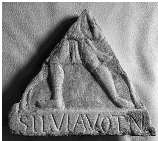
Slika 3.

Ovaj spomenik potiče s lokaliteta Crkvište, na lijevoj obali rijeke Bosne (nizvodno od njenog vrela) u Blažuju. Na ovom lokalitetu su do danas evidentirani značajni tragovi antičke građevinske djelatnosti. Bez obzira na ime lokaliteta, ovaj arheološki kompleks nesumnjivo je klasično-civilizacijske provenijencije, o čemu bi upravo svjedočila spomenuta posvetna ploča. 4