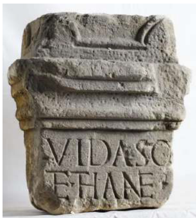
Slika 5.