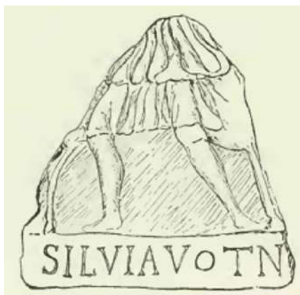
Slika 1. (Evans 1885, 16, fig. 1.)

Arthur Evans je u svome djelu Antiquarian Reserches in Illyricum (Parts III - IV) objavio jedan takav zanimljiv fragmentarni nalaz posvetne ploče s religijskim sadržajem: In 1880 I had the opportunity of renewing my explorations about this site. I was able to copy a small fragment from Blažui, representing the lower part of a figure of Diana standing before her doe, beneath which was an inscription, showing that it was part of a votive monument erected to the goddess by a votary of the appropriate name of Silvia. / „Godine 1880. imao sam priliku obnoviti svoja istraživanja o ovom mjestu. Uspio sam kopirati mali fragment iz Blažuja, koji predstavlja donji dio lika Dijane koja stoji ispred svoje srne, ispod kojeg je bio natpis koji pokazuje da je dio posvetnog spomenika koji je podigao dedikant boginji odgovarajućeg imena Silvia.“