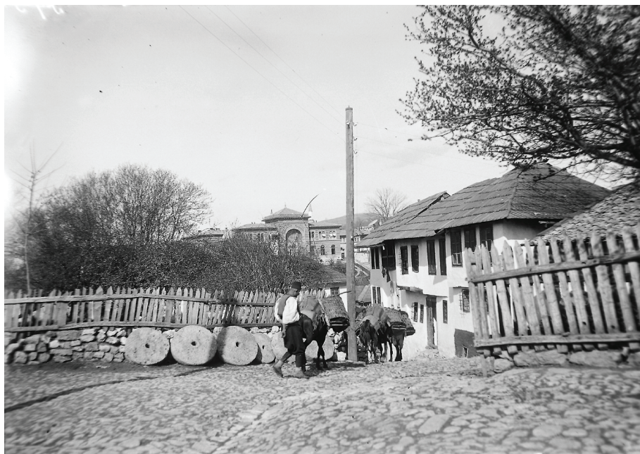
Nadkovači, 1896. godina

Opus Františka Franje Topiča predstavlja više od 6000 negativa na staklu. Svi ovi negativi navedeni su u inventarnim knjigama Zemaljskog muzeja Bosne i Hercegovine.