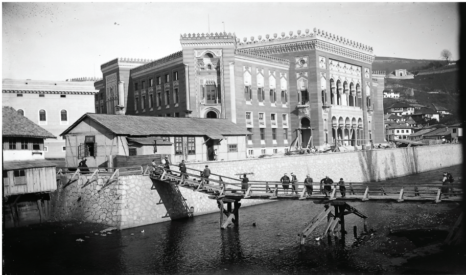
Sarajevska Vijećnica i drveni most, 1900. god.

Bosna i Hercegovina, njeni stanovnici, gradovi i sela postali su tema naučnog, sakupljačkog i umjetničkog rada mnogih austrougarskih službenika koji su tu živjeli. Rezultat tog rada su brojne zbirke poezije, proze, notni zapisi i dr. sakupljeni na području Bosne i Hercegovine, umjetnička djela te kolekcije fotografija snimljenih u Bosni i Hercegovini, od kojih je vjerovatno najznačajnija kolekcija Františka Franje Topića.