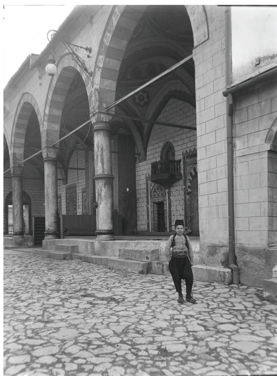
Harem Begove džamije, 1906. godina

Sarajevo je bilo posebna tema interesovanja Františka Topiča; na više od 500 fotografija koje se čuvaju u Odjeljenju za etnologiju Zemaljskog muzeja Bosne i Hercegovine predstavljen je neki segment ovog grada. Fotografije Sarajeva podijeljene su po sljedećim temama: Sarajevo (istočne granice), Staro Sarajevo (Begova džamija), Sarajevo (jevrejske starine, Vijećnica, Sarajevo sa svih strana), Sa izložbe iz Budimpešte, Pariza i Sarajeva, Ilidža (sa izložbe cvijeća na Ilidži), Butmir, Sarajevska čaršija, Sarajevo – Višegrad (naselja, kuće), Zbirka etnografskog odjeljenja (sobe, rezbarije, vez, sale, modeli). 8