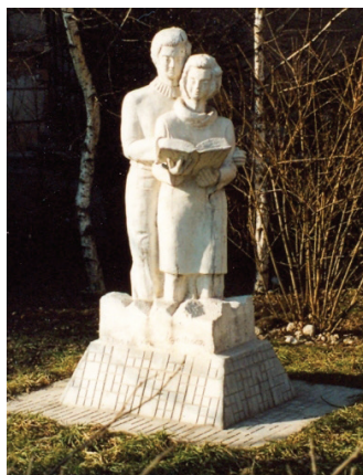
Učenik i učenica