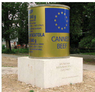
Spomenik Međunarodnoj zajednici – "Ikar"