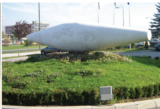
Skulptura Mustafe Skopljaka

Skulptura kamenog bloka (vrsta maljak) Mustafe Skopljaka, ispred Avaz business centra, postavljena 2005. godine, predstavlja dvadeset tona tešku uglučanu jajoliku masu, dugu 6,5, visoku 1,6 i široku 1,4 metra, 35 suženu pri krajevima, pomalo izolovanu i univerzalnu, koju obilježava potpuna čistoća oblika, pokušaj da se tema zgusne i pojednostavi. Brancusijevsko apsolutno jedinstvo forme koje poistovjećuje stvar s prostorom, a ne samo sa značenjem, našlo je svoj izraz u Skopljakovom djelu. Forma koja je jedna i nepromjenjiva podrazumijeva sve moguće varijacije. Simbolična, jer istovremeno definira pojedinačnu i univerzalnu stvar. To je skulptura koja je oslobođena granica predmetnosti, a plastičan geometrijski element shvaćen je kao obrazac ili primarna struktura. Skulptura rađena u radionici "Šišković" u Danilovgradu time pokazuje pravi izazov u opusu savremenih skulpturalnih djela javnog sadržaja.