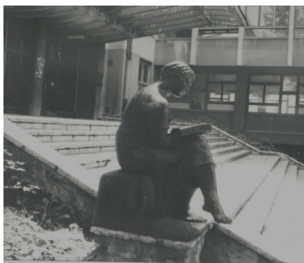
Djevojka sa knjigom

S lijeve strane stepeništa koje vodi do Arhitektonskog fakulteta u Sarajevu smještena je bronzana skulptura pod nazivom “Djevojka sa knjigom”, djelo akademskog kipara Ante Kostovića, na postamentu od kamena i betona. Bosačica djevojka, odjevena u dugu haljinu, sjedi oslonjena lijevom rukom na postament, dok u desnoj pridrži knjigu položenu na koljenima. Lice joj je mlado, oblo i sneno dok čita. Klupa na kojoj sjedi ima oblik stepenice. Djelo pripada poetskom realizmu umjetničkog kruga Frane Kršinića. Pretpostavlja se da je izrađena oko 1946. godine, sa signaturom kipara pri dnu postamenta.