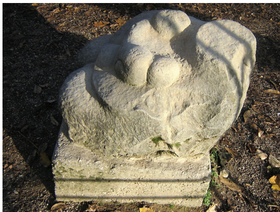
Dječiji park “Boško Buha”

Jedno od rijetkih spomen-obilježja koje zaslužuje biti istaknuto i valorizirano je i bronzana skulptura Josipa Broza Tita, postavljena u uređenom parkovskom prostoru kasarne “Maršal Tito”. Djelo je jednog od najpoznatijih kipara našeg doba Augusta Augustinčića. J. B. Tito prikazan kao komandir, u svoj vojničkoj snazi i poletu, odvažnosti, svečanoj odmjerenosti, imao je za cilj zračiti neustrašivošću i nepokolebljivošću u vezi sa svojim nakanama i idealima. Predstavljen u trenu raskoraka, vojničkog marširanja, zamišljena i oborena pogleda, u odori, s raskopčanim kaputom, upućuje na utjecaj klasične spomeničke skulpture širom svijeta, čiji je cilj glorifikacija velikana – vođa nacija. 41 Skulptura je doživjela nebrojen broj replika, kopija u manjim i većim dimenzijama te različitim materijalima.