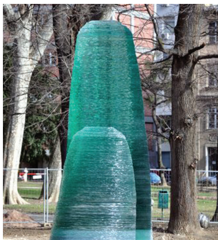
Spomen-obilježje ubijenoj djeci Sarajeva