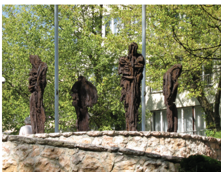
Earth Aux Mortus

Sušтина je upravo u pokretu, dinamizmu, nesagledivoj snazi i energiji, bez koje tijelo bicikla postaje bezvrijedno i time apsolutno nekorisno. Umjetnik pun fantazije, ekspresivne snage, dubokih emocija,