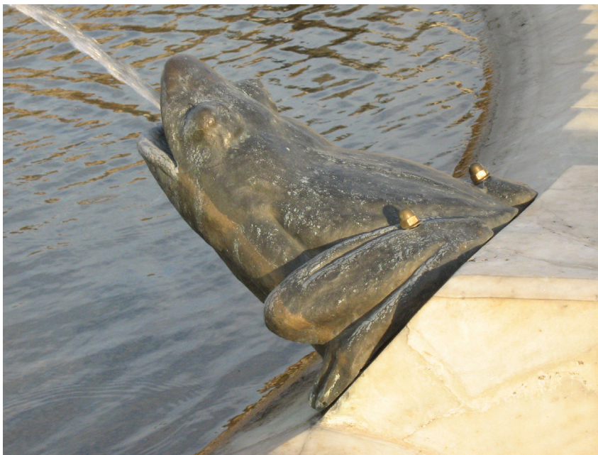
Fontana ispred Željezničke stanice

noseći rožnate, oštre i bujne laticice. Rub mermernog bazena je izbrazdan, rebrast, dok je sam bazen kružno obavijen plastično naglašenim prstenom, između je prostor s rebrastim šahtovima za sakupljanje viška tečnosti što se prelijeva iz bazena i čeljusti daždevnjaka.