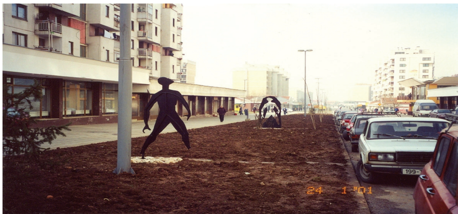
Neuništivo ljudsko biće

naslov ove skulpture: “Multikulturalni čovjek izgrađivat će svijet” , Sarajevo, 14. juli 1997. godine. 18 Ni kompozicijski a ni tematski djelo ne nudi jasan odgovor na zadanu temu. Osim što pruža osrednje skulpturalno rješenje, ono se ne uspijeva prilagoditi postojećem okruženju, narušavajući time skladnost ambijentalnih i pejzažnih karakteristika prostora trga, prostora unutar kojeg djeluje agresivno i oštro, negirajući uspostavljenu intimnu atmosferu mjesta u kojem egzistira silom.