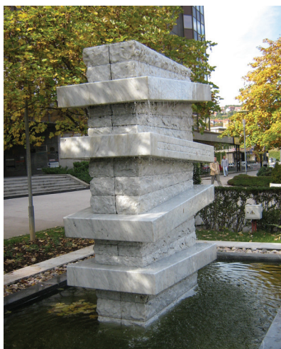
Spomen-fontana Hakiji Turajliću

i “Hercegovina”, fontana u zaleđu Hipotekarne banke 44 (“Kupačica”, Vladimir Zagrodnjikov), fontana ispred Željezničke stanice (Marijan Kocković, “Djevojka sa lirom” (Marijan Kocković, Društveni dom Hrasnica), “Kupačica” (gradski park u Vogošći), fontana “Stablo” (Vogošća), “Cik zore” (Jovan Nježić, zamišljena kao dio kompleksa fontane, Mojmilo), fontana ukomponirana u kompleksno prostorno rješenje (park ispred Skupštine grada Sarajeva), fontana ukomponirana u spomen-obilježje Đure Đakovića (Skenderija), u sklopu granitnog platoa uz zgradu Izvršnog vijeća (Dušan Džamonja), uz hotel Holiday i UNIS-ove nebodere (Ivan Štraus) itd. 45 Danas je, nažalost, veliki broj njih devastiran, pretvoren u smetlišta, lišen svoje funkcije. Tek nekoliko primjera služi više kao podsjetnik da su egzistirale na ovom području te da je tek jedan dio prijeratnih fontana i dalje zadržao svoju svrhu. Ovim se, naravno, otvara mogućnost, ali i dužnost uspostave novih te nužne restauracije postojećih.