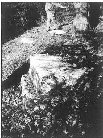
Sanduci sa postoljem.

obrade, veličine i značaja. Ono što se odmah primjećuje jeste da je nekropola nastajala sukcesivno, da su stećci koji su smješteni istočnije starijeg datuma, a da su oni koji su se nastavljali na njih orijentirani u pravcu Z – I, novijeg datuma (pri tome ovo, naravno, nije bilo pravilo, jer su ugledni članovi zajednice ukopavani uvijek i samo uz najznačajnije ličnosti svoga bratstva, pa čak i ako ih dijeli nekoliko stotina godina).