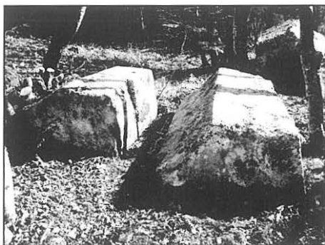
Sljemenjak sa postoljem i dvojni sljemenjak sa postoljem.

obrade, veličine i značaja. Ono što se odmah primjećuje jeste da je nekropola nastajala sukcesivno, da su stećci koji su smješteni istočnije starijeg datuma, a da su oni koji su se nastavljali na njih orijentirani u pravcu Z – I, novijeg datuma (pri tome ovo, naravno, nije bilo pravilo, jer su ugledni članovi zajednice ukopavani uvijek i samo uz najznačajnije ličnosti svoga bratstva, pa čak i ako ih dijeli nekoliko stotina godina).