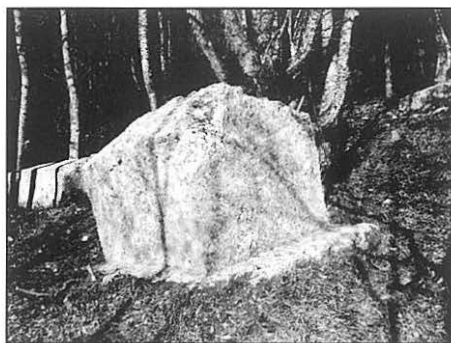
Sljemenjak sa postoljem.

Kod većine je postolje homogeno sa glavnim dijelom spomenika. Nisu ni svi sljemenjaci i sanduci istog oblika, neki su niži, a neki, opet, viši (ukupno 6). Sanduk je klesan kao četverostrana prizma, oblikom vrlo sličan ploči iz koje se, najverovatnije, i razvio. Nekim sanducima su čeone i bočne strane neznatno skošene prema dolje, približnih dimenzija: dužina od 150 do 200 cm, širina od 70 do 150 cm i visina između 40 i 80 cm. Dimenzije sljemenjaka su slične dimenzijama sanduka, uz poneka odstupanja.