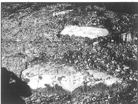
Sanduci sa postoljem i amforni oblici.

prelaznih tipova greblja. Ovi amorfni oblici se javljaju kroz čitav vremenski period stećaka, pa možemo reći da su i oni nastajali sukcesivno.