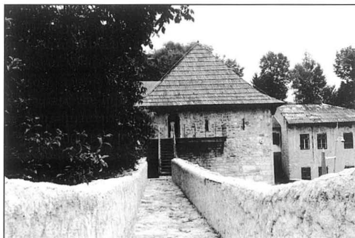
Kameni bedem spaja kulu Ploča sa kulom Širokac, 2008. godina

pristupiti snažnijem osiguravanju grada, u najmanju ruku njegovog rezidencijalnog dijela, a to je tada bio Vratnik. Godine 1727. tadašnji bosanski valija, Ahmet-paša Rustempašić Skopljak, izdao je naredbu o utvrđivanju grada Sarajeva. Po prvi i posljednji put u historiji Sarajeva dešava se utvrđivanje grada putem izgradnje odbrambenog zida.