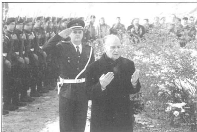
Alija Izetbegović odaje počast šehidima ukopanim na Kovačima, 1995. godina

sistematskog organiziranja odbrane, državničkog rada tokom agresije, te konačnog – pod velikim pritiskom vršenim na Izetbegovića – potpisivanja Daytonskog mirovnog sporazuma, Alija nastavlja da se bori za Bosnu i Hercegovinu i njeno bolje društvo. Iako već dosta umoran, on odlučuje da nastavi svoj politički angažman s ciljem jačanja države Bosne i Hercegovine.