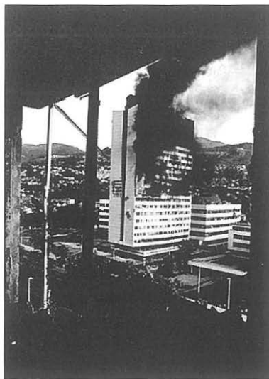
Spaljivanje zgrade skupštine BiH za vrijeme granatiranja 1992. godine.

Iako je tada slijedio jedan period stabilizacije i normalizovanja, bosanska vlast je 19. marta 1996. godine opsadu Sarajeva objavila konačnom