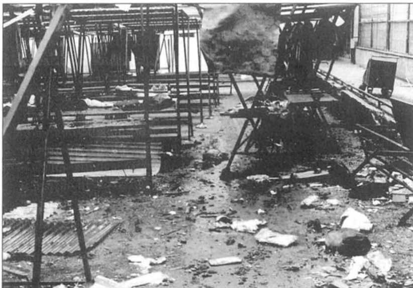
Pijaca Markale, 5. februara 1994, Arhiv Instituta za istraživanje zločina protiv čovječnosti i međunarodnog prava Univerziteta u Sarajevu, Masovno stradanje civila na pijaci "Markale" dana 05. 02. 1995, dok. br. 2-956.