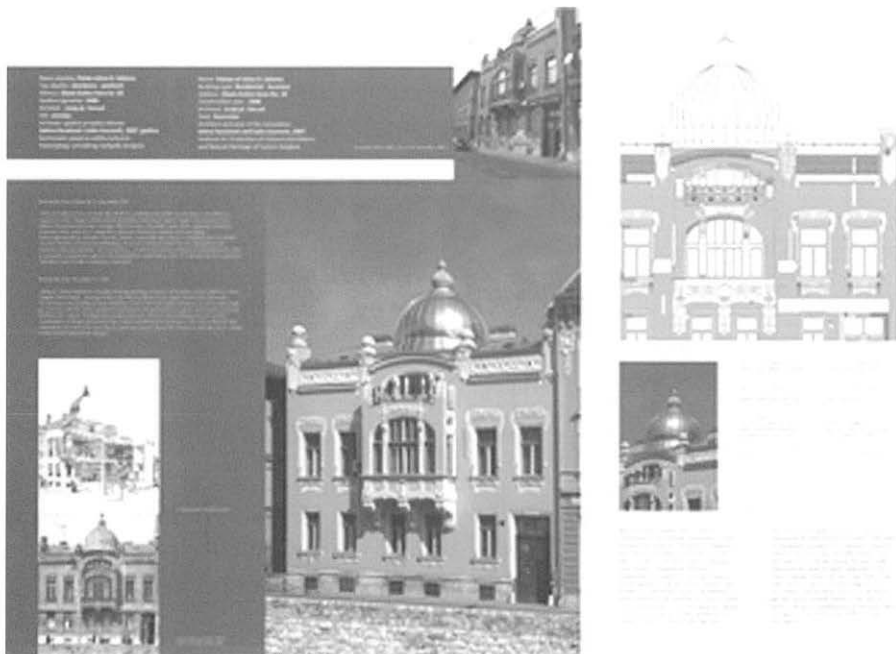
Palata Ješue D. Saloma