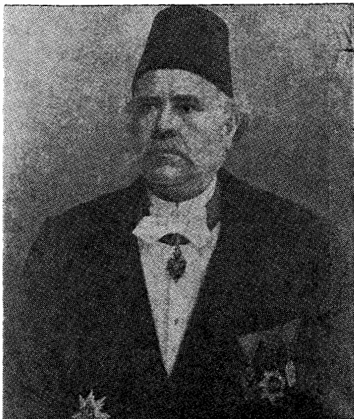
Ivana Kobilca, Mehmed-beg Kapetanović Ljubušak